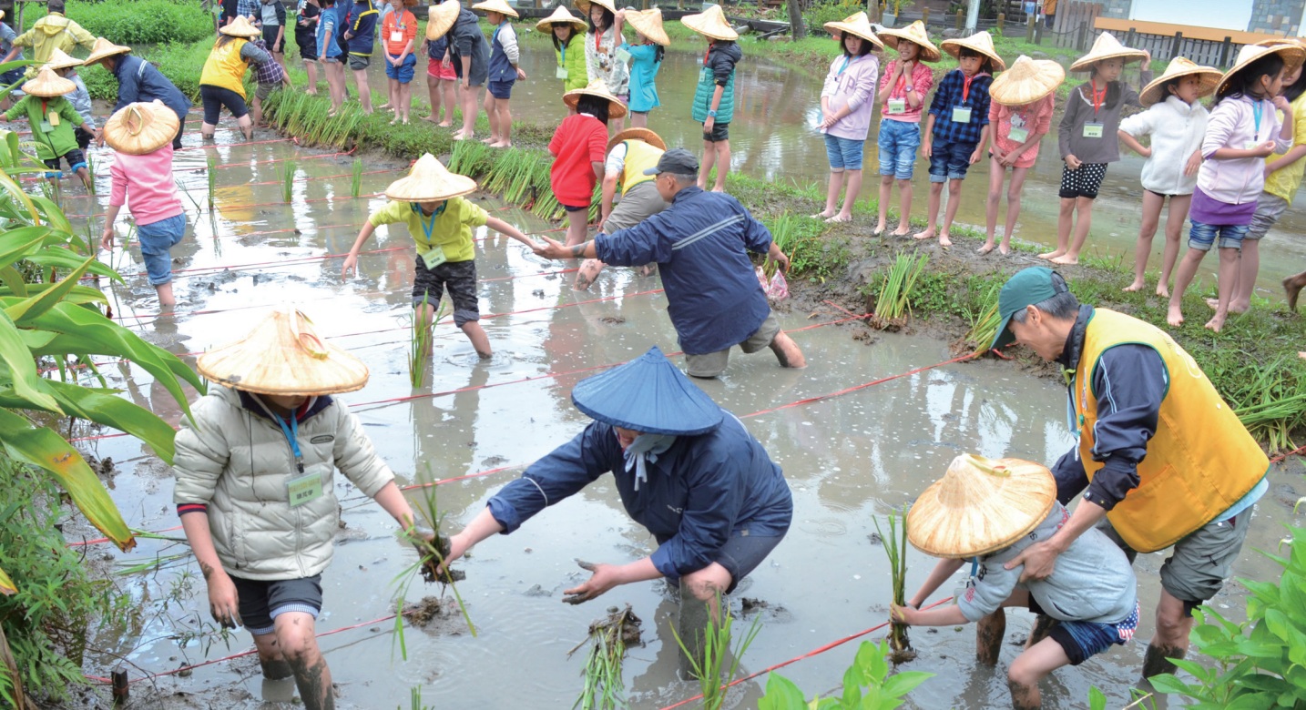
春耕美人腿—筊白筍農田溼地生態學習及種植體驗