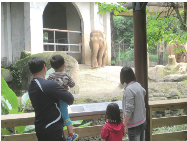
展區現場的解說資料，成為父母教導孩子環境教育的最佳教材