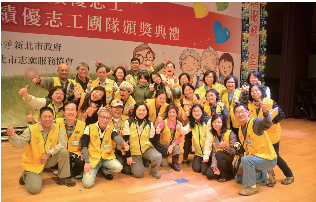
臺北動物園服務團隊—榮獲行政院衛生福利部 103 年度「全國績優志工團隊」獎項

環境教育功能是動物園存在的最大使命之一，以臺北動物園每年逾 300 萬人次遊客的參訪，更是推展環境教育的最佳契機。未來將從展示場設計搭配解說設施與實體等教材，再輔以營隊及行動動物園等課程活動，進一步透過數位資訊與多樣傳媒通路行銷，持續傳遞環境教育觀念。