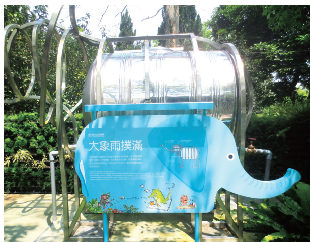
雨水回收再利用—大象雨撲滿

建置再生能源示範園區，其酷 cool 節能屋以綠建築概念設計，加入 3 隻小豬與自然精靈等童話角色，建立互動性解說設施，向民眾傳遞節能的可行性；園區內之