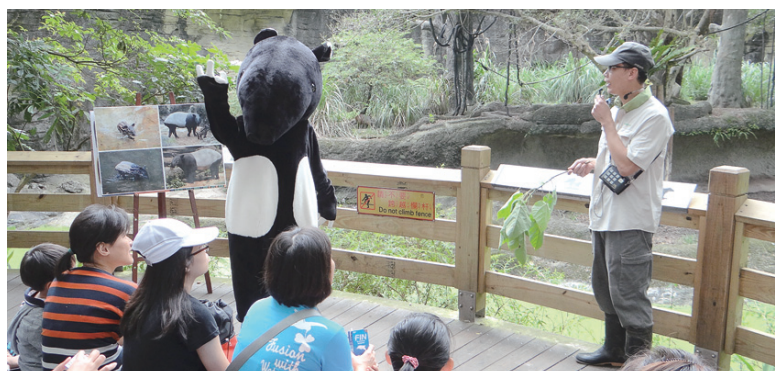
動物保母講古—世界「獺」日來我家

營造無毒友善管理措施，為避免因使用化學清潔劑產生環境賀爾蒙危害生態，臺北動物園推動無毒友善公廁，以鳥園及靈長類吃剩的果皮，回收製成環保清潔劑，不但減少化學藥劑使用，也讓廁所飄散水果清香，還能減少園區廚餘量，成為國內無毒廁所之模範。