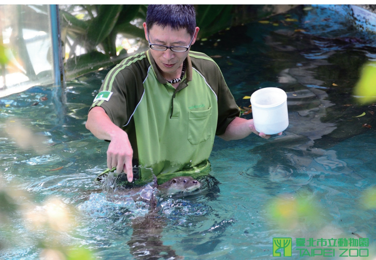
保育員教「大金、小金」水獺兄弟抓魚

「大象長長的鼻子正昂揚，全世界都舉起了希望」，我們相信經由環境教育喚起民眾對生態破壞及物種滅絕的覺知，使其認識及正視環境問題，瞭解日常生活中的環境保護機會，導引正向的環境價值觀，進而付出友善環境行動是一件重要的事。我們具有專業的動物保育知能及多元獨特的體驗活動與課程，並與園內的野生動物為伴，邀請民眾一起加入我們，為野生動物開創未來，為地球永續發展而努力，實現「快樂天堂」而努力不歇。