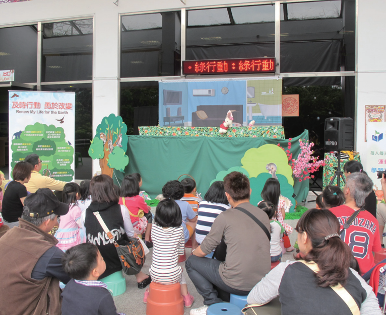
動物歡樂派對—節能減碳綠行動