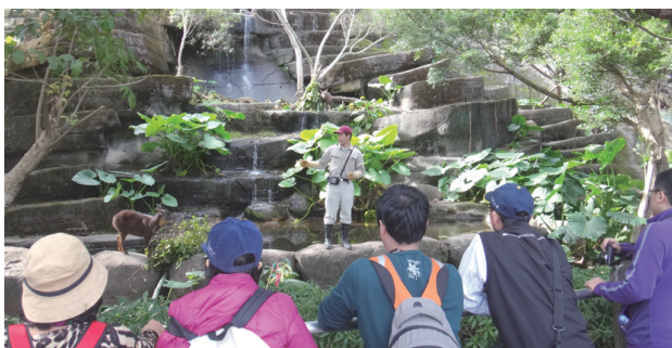
動物保母講古—長鬃山羊生活型態及棲地特性介紹

臺北動物園以全球生態地理分區規劃展示，在展示介面上建立景觀沉浸與棲所模擬的環境，使野生動物與人文意象融合，民眾彷彿置身於動物原生的棲地，更能接收生態保育的觀念。另亦建立自然生態探索學習步道系統，以昆蟲館連結其後山保留原始棲地面貌的蟲蟲探索谷，成為生物多樣性野外觀察教室，是民眾探索自然的最佳場所。