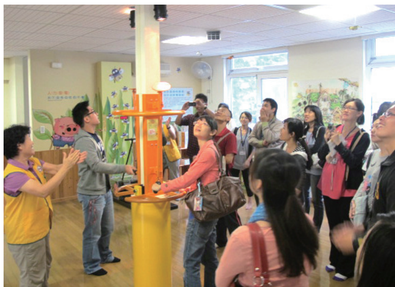
酷 cool 節能屋光纖教具體驗

規劃能量循環園區，結合園區大量的動物糞便及枯樹枝粉碎混入製作堆肥，堆肥發酵後即是改善展場土質及園區植栽的養分，成就今日園區生生不息與綠意盎然的景觀。