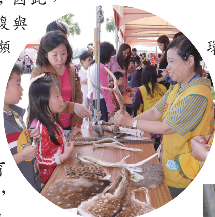
鹿鼎記教育駐站臺灣梅花鹿的美麗與哀愁

在等待原棲地恢復與再野放之前，將瀕危物種圈養在人為的環境（動物園）中進行域外保育是方法之一；另一方面藉由保育繁殖的管理技術，適度地擴大族群的數量，是動物園的保育策略。然而成