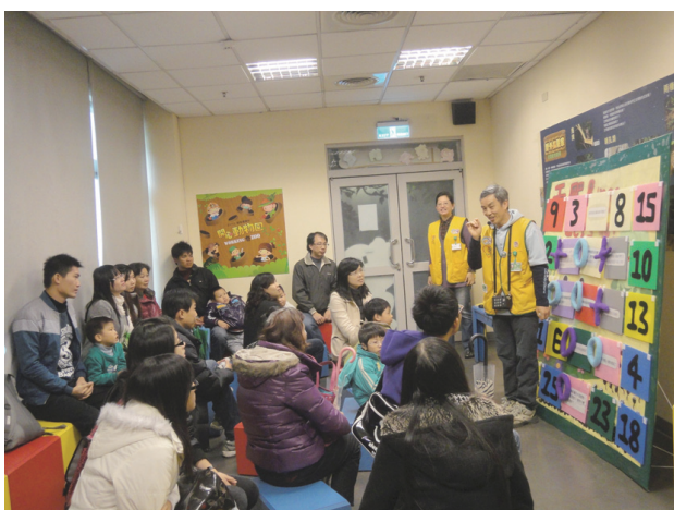
爬蟲館—史奈克的窩

森林」拜訪動物園夜間出沒的動物好朋友等；「定時定點課程」，在爬蟲館史奈克的窩、昆蟲館小學堂、酷 cool 節能屋及兒童劇場等現場教室，帶領入園民眾進入環境教育的學習天地；「團體客製化課程」則配合機關團體行程及學習議題的需求而安排課程；「自導式學習」行程，以導覽解說加上解說設施的說明，讓民眾可在園區內悠閒自在地進行環境教育學習。另以「行動動物園」走出園區硬體範圍的框架，帶著寓教於樂的生態遊戲與教材，將野生動物保育與教育的訊息，傳遞給偏遠地區無法入園的學童及團體瞭解保育之重要性。