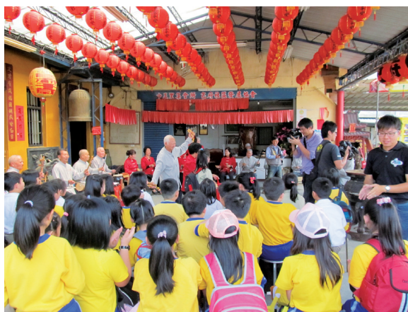
校外教學參觀地方人文