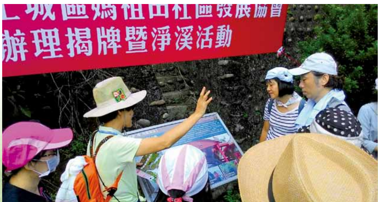
參與媽祖田社區所舉辦的文化生態之美活動

在推廣環境教育的過程中，為了充實與提升員工對環境教育的知識，我們不定期邀請不同領域的專家宣導相關環境知識，直接與間接地傳達環境教育觀念；另外，於戶外舉辦的活動，皆會選定國際特殊節日（如地球日、環境日等）一併舉行，讓參與人員能夠同時對環境保護節日有所認知，更進一步連結活動舉辦的意義，像是105年4月「大溝溪導覽」活動；105年5月「桐花步道文化導覽」之旅，邀請供應商一同學習當地生態與古蹟文化；105年9月「媽祖田淨山生態導覽」，認識媽祖田的文化生態之美；105年11月「臺北盆地的前世今生」環境教育之旅，參觀認證之環境教育設施場所「內雙溪自然中心」。透過戶外環境教育的啟蒙，讓每個人開始關心周邊環境，多一分的留意，就多一分的愛護。