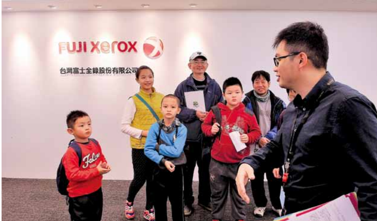
Live Office 小學生參訪

參照全球永續性報告協會(GRI)提出的G4報告書綱領撰寫，依此國際規範檢視其整體活動之表現。過去歐盟RoHS標準強調3R策略(Recycle、Reuse、Reduce)，現今社會推崇落實循環經濟，講求使用再生能(資)源，讓原料能從搖籃到搖籃，回歸大自然循環。台灣富士全錄順應新經濟體系，利用報廢事務機外殼，回收再製造出「環保手機座兩用名片盒」，翻轉民眾對「廢棄物」的概念，不僅獲得熱烈回響，更充分反映出循環經濟下，原物料回收再利用的成功案例。