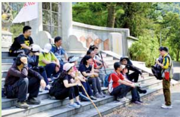
大溝溪環境教育導覽

每月檢討績效指標達成度，並於年底召開管審會議，進行品質管理循環流程之改善。90年至今，連續16年取得ISO 14001環境管理系統認證；103年通過ISO 50001能源管理系統認證；104年導入ISO 14064-1溫室氣體盤查；104年通過雨林聯盟FSC CoC驗證。