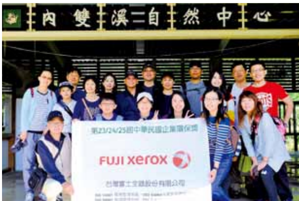
參訪內雙溪環境教育自然中心