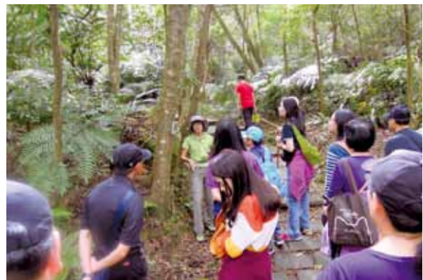
臺北盆地的前世今生